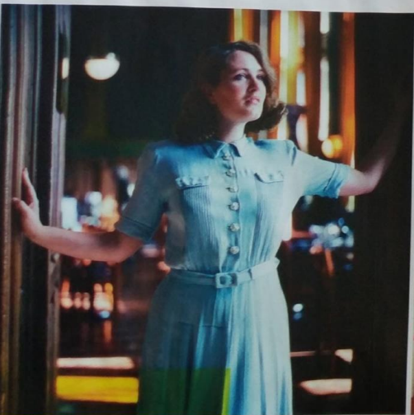
"Duur? De meeste jurken kosten minder dan 35 euro."

retroïngerie, van het merk What Katie Did bijvoorbeeld. Alleen met fietsen trek ik een gewone panty aan, dat is niet even makkelijk, maar vaak heb ik vintage kousen aan. Meestal met jarretelles, gekocht via Marktplaats. Als je regelmatig op 'oude panty's' zoekt, krijg je wel gekke dingen te zien trouwens, bijvoorbeeld mannen die gedragen panty's willen kopen. Om de week ga ik een dag alle favoriete winkels af en soms bezoek ik speciale beurzen. Duur is shoppen op deze manier niet. Ik heb maar weinig jurken die duurder waren dan 35